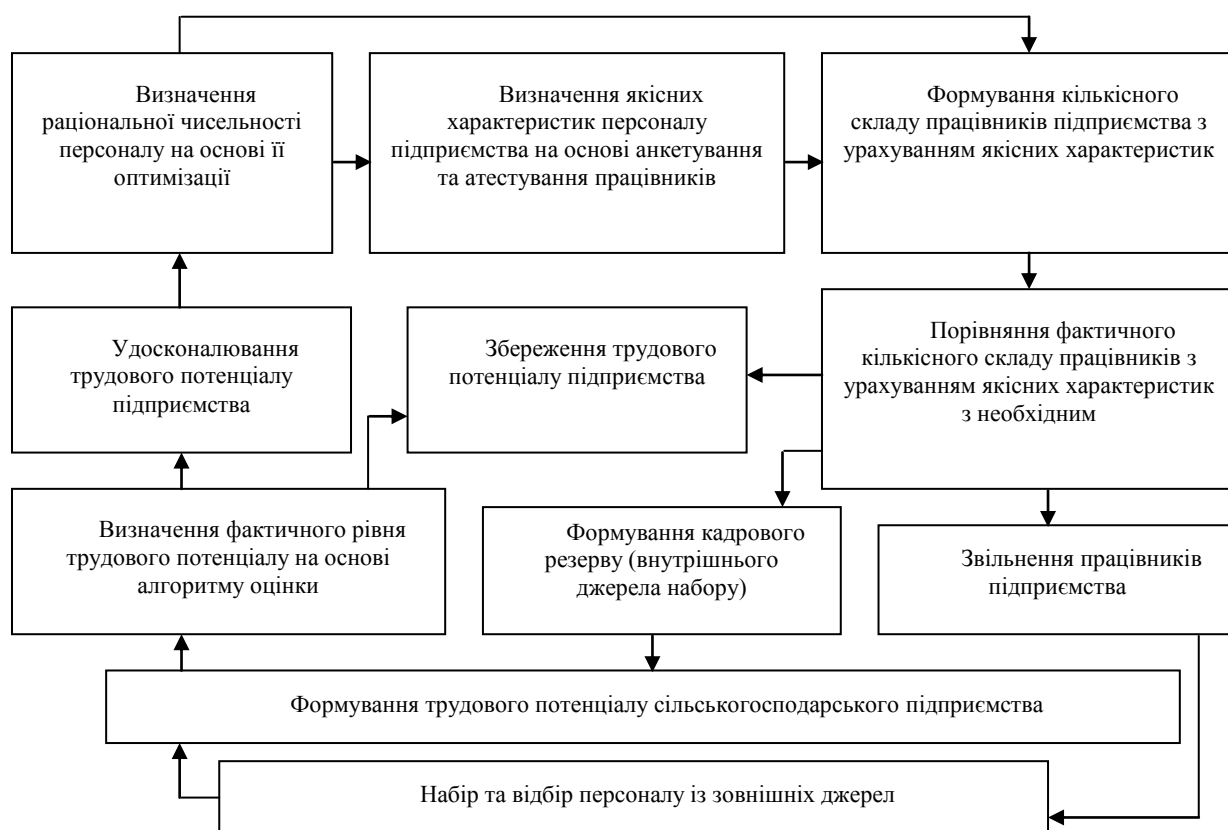
Рис. 2. Схема механізму формування трудового потенціалу сільськогосподарського підприємства

Результати проведених нами досліджень дозволяють дійти таких висновків.