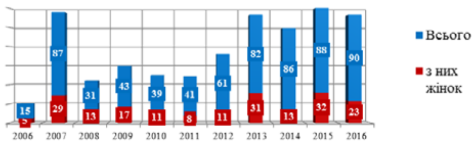
Рис. 1. Кількість осіб, взятих на облік Центром обліку бездомних осіб

Діяльність Центру обліку бездомних осіб. У 2006 р. рішенням виконавчого комітету Уманської міської ради створено Центр обліку бездомних осіб. До його завдань віднесено виявлення та ведення обліку бездомних осіб, забезпечення реалізації бездомними особами прав та свобод, надання соціальних послуг, що включають допомогу в оформленні або відновленні документів; сприяння в реєстрації місця проживання або перебування; встановлення зв'язків з іншими фахівцями, службами та організаціями [6]. На рис. 1 представлено інформацію щодо кількості осіб, які були взяті на облік в Центрі обліку бездомних осіб за час існування цієї структури.