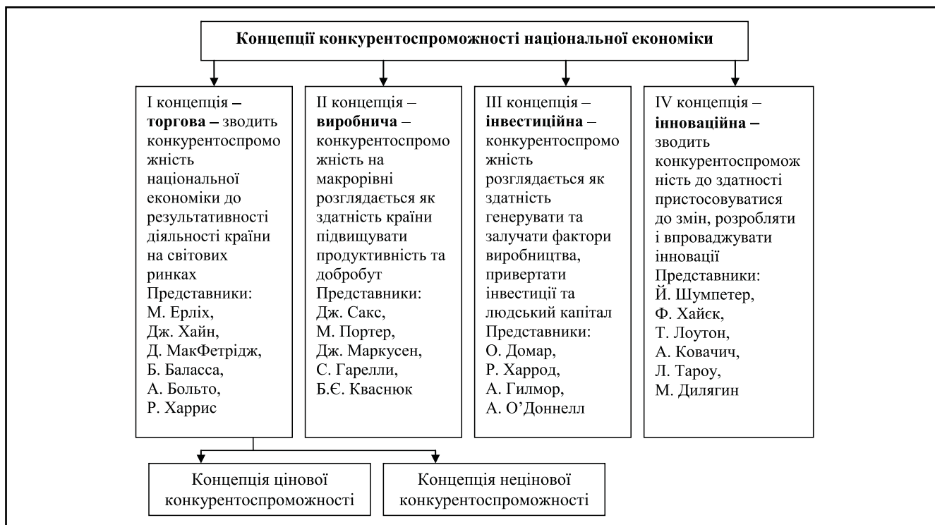
Рисунок 1. Концепції конкурентоспроможності національної економіки

огляд: порівняльна перевага в промисловості: зміна торгових і ресурсних профілів країн», у звіті Всесвітнього банку «Китай: реформи в галузі експортної торгівлі» та ін.