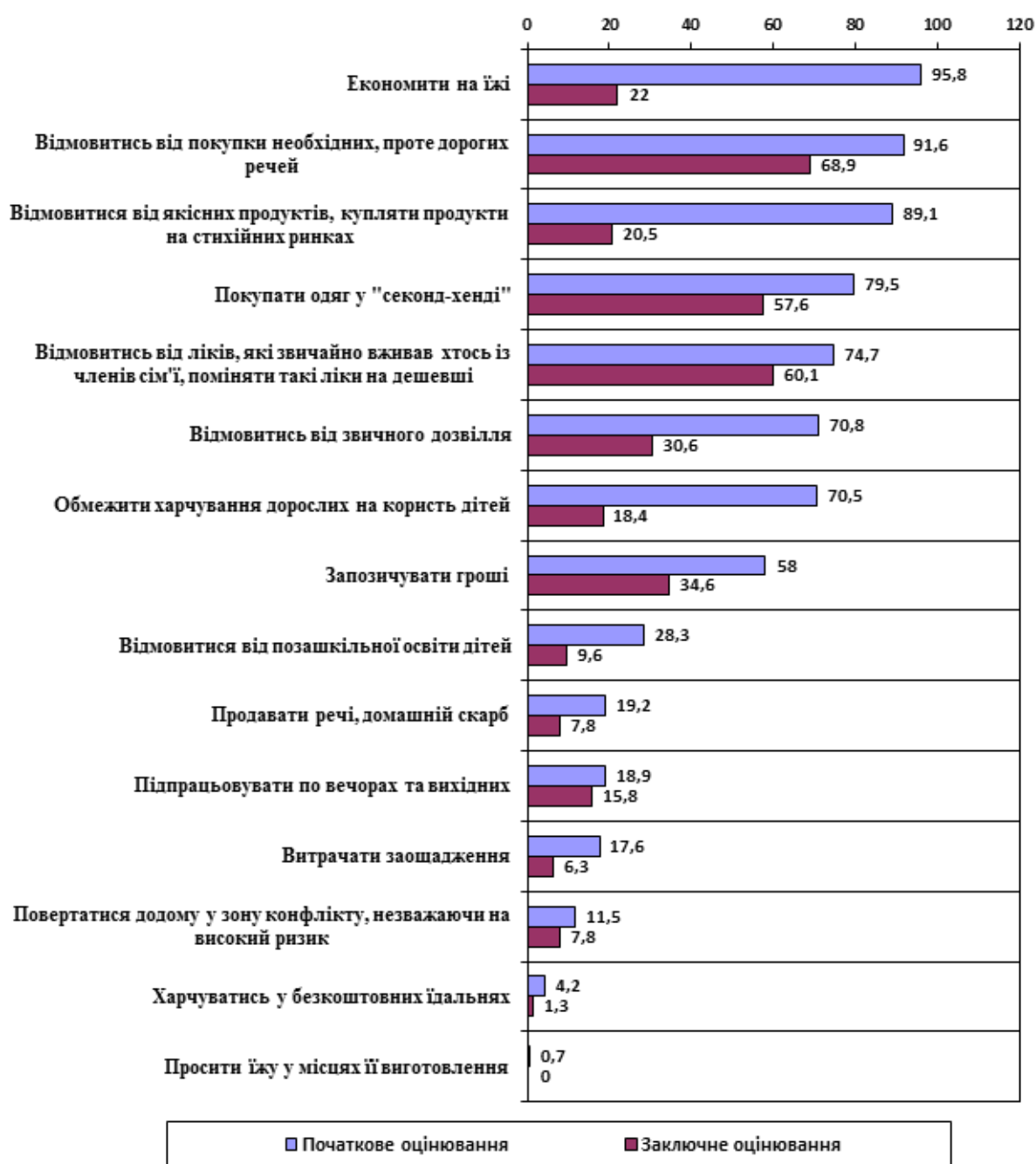
Рис. 3. Порівняння відповідей учасників на запитання: «Що з переліченого вам і членам вашої сім'ї приходилося робити [за останній час] для задоволення основних потреб сім'ї?» під час початкового (n=2831) і заключного (n=396) оцінювання, %.

У ході впровадження соціальної програми значно зменшилася кількість сімей-учасників, які застосовують ризиковані способи виживання, подолання складних ситуацій та вирішення проблем. Так, більш ніж на 40% знизилася частка сімей, які для задоволення базових потреб економили на їжі, відмовлялися від якісних продуктів та купляли продукти на стихійних ринках, обмежували харчування дорослих на користь дітей, відмовлялись від звичного дозвілля; більш ніж на 20% скоротилося число тих, хто відмовлявся від купівлі необхідних, проте дорогих речей, купляв одяг у «секонд-хенді», запозичував гроші, на 10% – тих, хто відмовлявся від позашкільної освіти дітей, від звичних та якісних ліків, витрачав заощадження та продавав домашній скарб (рис. 3).